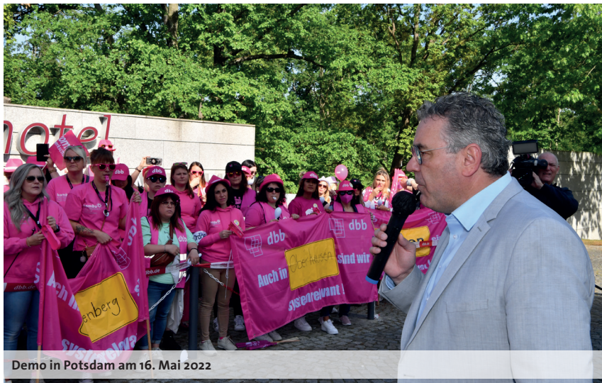
Demo in Potsdam am 16. Mai 2022

Die dbb Verhandlungskommission schloss sich dieser Sichtweise an und votierte ohne Gegenstimme für die Annahme des Kompromissvorschlags.