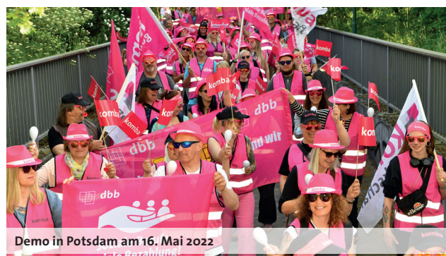
Demo in Potsdam am 16. Mai 2022

TV Entgeltordnung Sozial- und Erziehungsdienst 2022